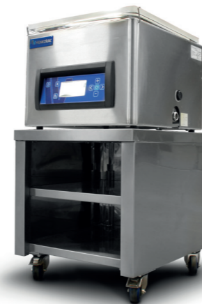
ONDERZETKASTJE VOOR T2, T3 & T4