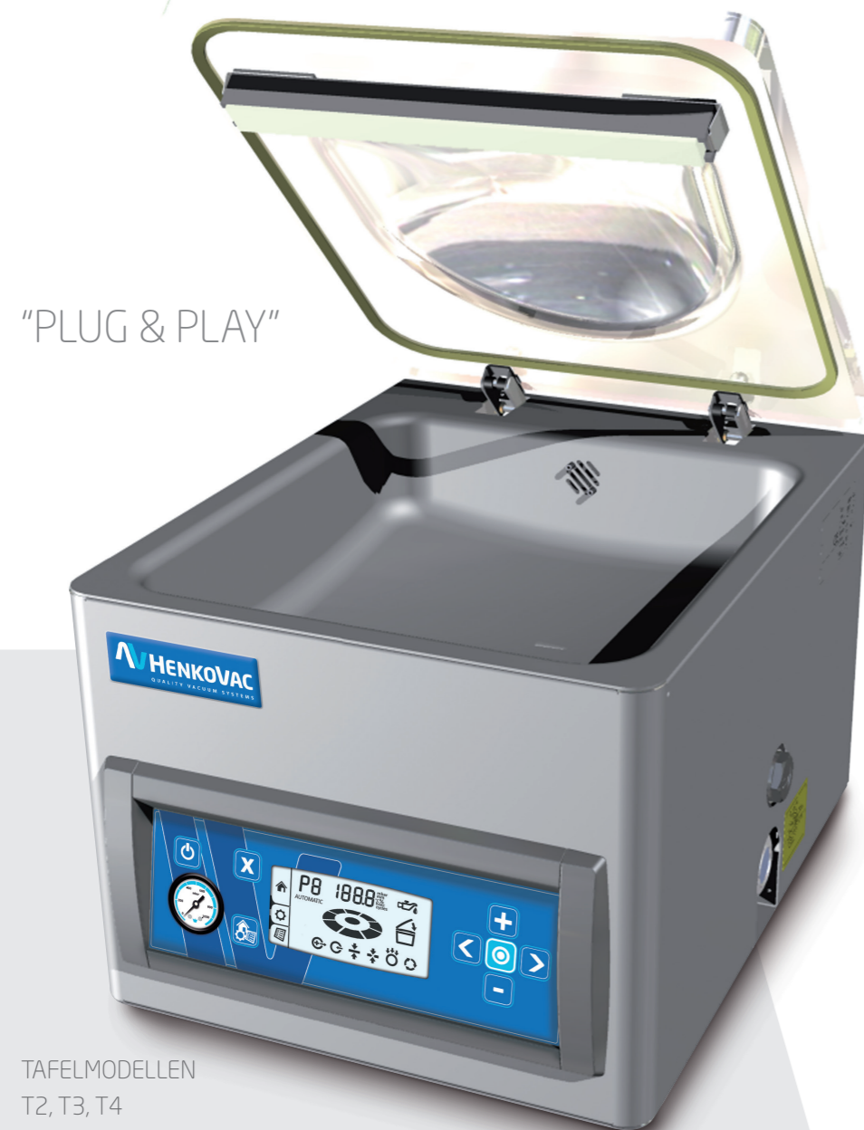
TAFELMODELLEN T2, T3, T4